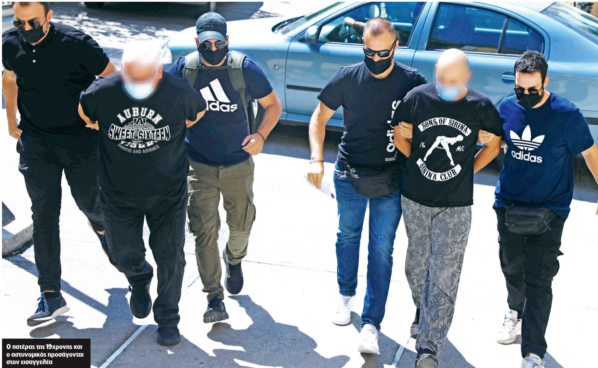
Ο πατέρας της 19χρονης και ο αστυνομικός προσάγονται στον εισαγγελέα

Του ΠΑΝΑΓΙΩΤΗ ΣΟΥΡΕΛΗ p.sourelis@realnews.gr