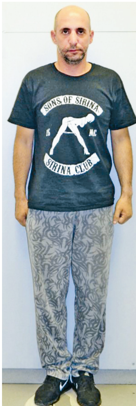
Η Αστυνομία έδωσε στη δημοσιότητα τις φωτογραφίες του 39χρονου αστυνομικού