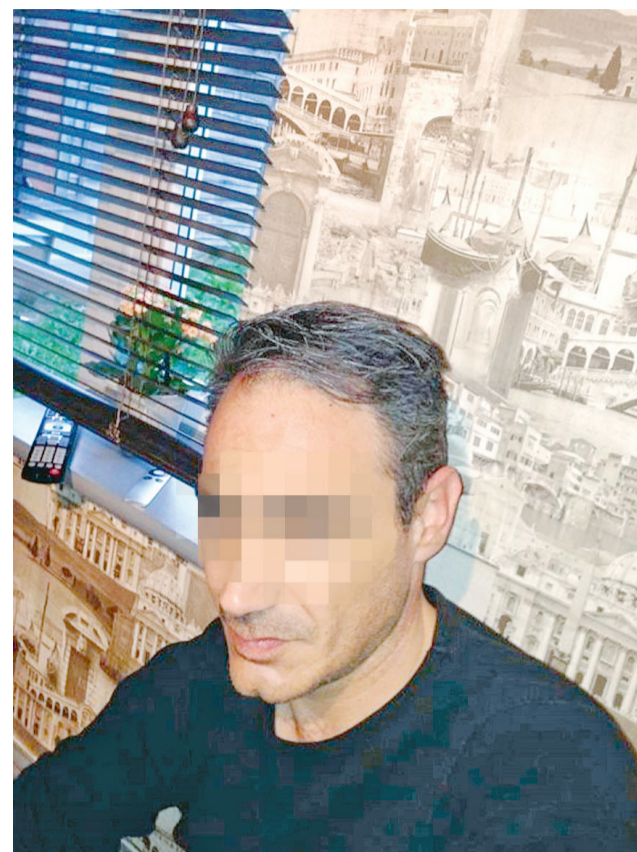
Ο 49χρονος υποστήριξε πως το σχέδιο του Ιταλού Γουλιέλμο Κάτσια το χρησιμοποίησε ως... χαρτοπεσέτα

Ο ελαιοχρωματιστής δεν έπεισε τον εισαγγελέα ότι το μόνο κίνητρο για την κλοπή ήταν το πάθος του για την τέχνη