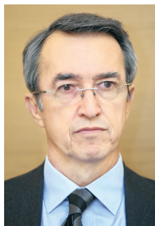
Ο ΚΑΘΗΓΗΤΗΣ Κοινωνικής και Προληπτικής Ιατρικής του ΕΚΠΑ, Γιάννης Τούντας