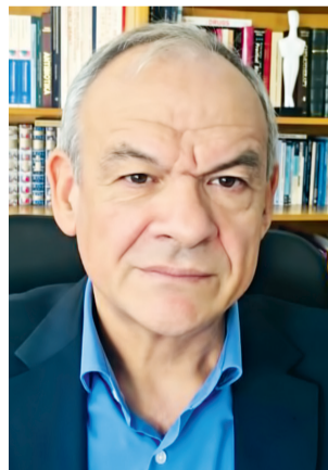
Ο ΚΑΘΗΓΗΤΗΣ Φαρμακολογίας στο Δημοκρίτειο Πανεπιστήμιο Θράκης, Ευάγγελος Μανωλόπουλος

28/1/2021), ο ρυθμός ημερήσιας μείωσης των θανάτων και των διασωληνωμένων ασθενών συνεχώς επιβραδύνεται και οι σχετικές πτωτικές καμπύλες τείνουν να μηδενιστούν τις επόμενες ημέρες. «Με βάση αυτές τις εκτιμήσεις, η καμπύλη των θανάτων αναμένεται άμεσα να αντιστραφεί από πτωτική σε ανοδική και των διασωληνωμένων σε περίπου δέκα ημέρες», τονίζει ο καθηγητής Κοινωνικής και Προληπτικής Ιατρικής του ΕΚΠΑ.