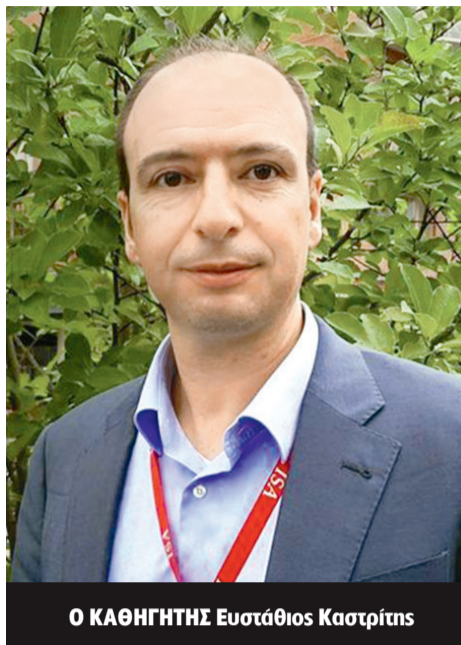
Ο ΚΑΘΗΓΗΤΗΣ Ευστάθιος Καστριτίης

«Η ανάπτυξη μονοκλωνικών αντισωμάτων έναντι του SARS-CoV-2 αποτελεί μια πιθανή θεραπευτική επιλογή για ορισμένες ομάδες ασθενών», εξηγούν οι καθηγητές Θεραπευτικής Κλινικής της Ιατρικής Σχολής του Εθνικού και Καπο-