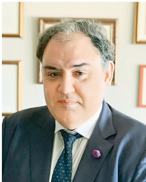
Ο ΚΑΘΗΓΗΤΗΣ Δημοσθένης Σαρηνγιάννης

Εφιαλτικό σενάριο για τον Δεκέμβριο και σήμα κινδύνου από τη νέα έκθεση του Δημοσθένη Σαρηνγιάννη. «Κινδυνεύουμε να γίνουμε Ιταλία, αν δεν εφαρμόσουμε τα μέτρα», δηλώνει στην «R» ο καθηγητής του ΑΠΘ