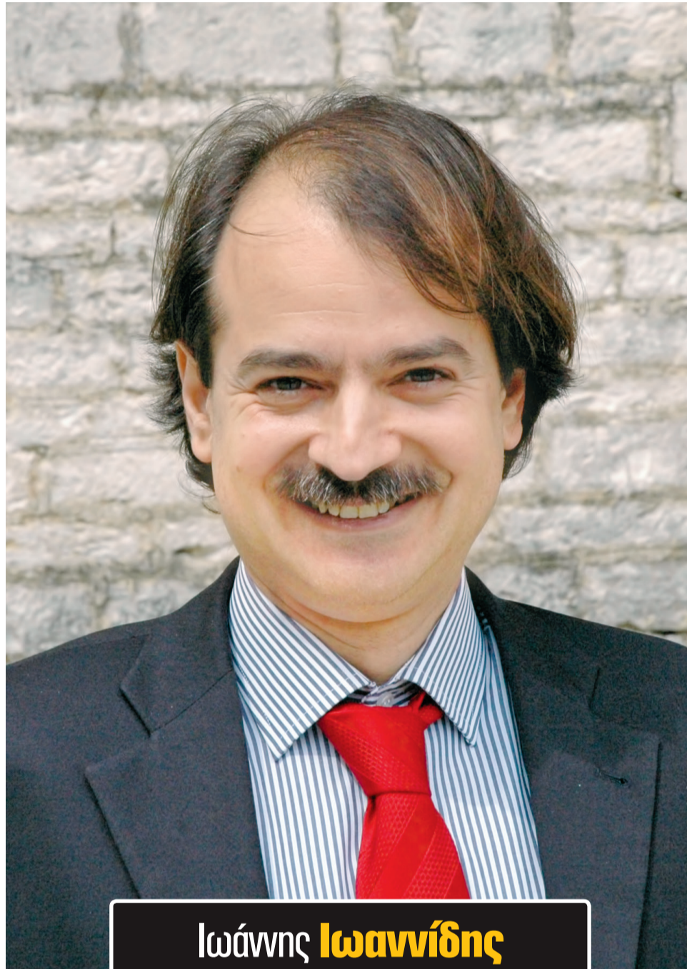
Ιωάννης Ιωαννίδης Καθηγητής στο Πανεπιστήμιο Στάνφορντ

Οι σημαντικότεροι παράγοντες για το αν θα διατηρήσουμε τον έλεγχο της πανδημίας είναι το κατά πόσο θα μπορέσουμε να εμποδίσουμε τον ιό να χτυπήσει γηροκομεία, νοσοκομεία και ευπαθείς ομάδες. Υπάρχει παρανόηση στο τι σημαίνει "ευπαθής ομάδα". Για παράδειγμα, αν κάποιος έχει απλώς υπέρταση, αυτό δεν αυξάνει τον κίνδυνο θανάτου. Ένας κατά τα άλλα υγιής 50-70 ετών με ελεγχόμενη υπέρταση έχει κίνδυνο θανάτου κάπου 0,1%-0,4%, αν μολυνθεί. Αντιθέτως, ένας τρόφιμος γηροκομείου, με πολύ εύθραυστη υγεία, έχει 25% πιθανότητα θανάτου αν μολυνθεί. Απρόβλεπτοι παράγοντες, όπως μια σύρραξη, μια κοινωνική αναταραχή από διαφανόμενη συντριβή της οικονομίας ή μια λήψη νέων επι-