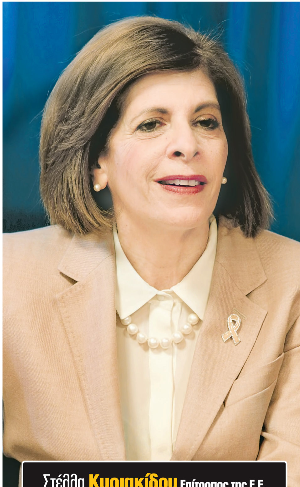
Στέλλα Κυριακίδου Επίτροπος της Ε.Ε. αρμόδια για την Υγεία και την ασφάλεια τροφίμων

Η κατάσταση είναι αρκετά επισφαλής στο παρόν στάδιο και οι ισορροπίες λεπτές. Όπως αναφέρεται στην τελευταία εκτίμηση κινδύνου από το Ευρωπαϊκό Κέντρο Πρόληψης Νόσων, αυτό οφείλεται κυρίως στο γεγονός ότι, όταν οι χώρες ανέκτισαν τον έλεγχο της μετάδοσης και μείωσαν το βάρος στην υγειονομική περιθάλψη, πολλά μέτρα χαλάρωσαν ή αφαιρέθηκαν για να επιστρέψουμε σε έναν πιο βιώσιμο τρόπο ζωής, με τον ιό, όμως, να κυκλοφορεί ακόμη ανάμεσά μας. Βλέπουμε, δυστυχώς, αύξηση στα περιστατικά σε πολλές χώρες της Ε.Ε. Συνεπώς, ο τρόπος που θα λειτουργήσουμε τώρα θα καθορίσει εάν θα έχουμε ένα γενικευμένο δεύτερο ξέσπασμα ή όχι. Αναφέρομαι σε ένα συνδυασμό που πρέπει να υπάρξει μεταξύ των μέτρων που λαμβάνονται από