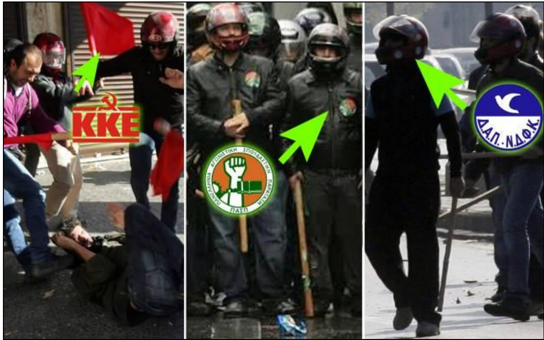
["Τάγματα εφόδου ΤΩΝ ΚΑΤΗΓΟΡΩΝ ΜΑΣ ΣΕ ΔΡΑΣΗ"]