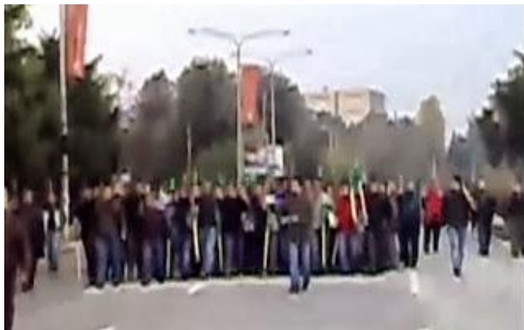
["Τάγμα εφόδου ΠΑΣΟΚ" προελαύνει συντεταγμένα]