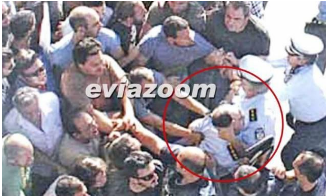
[Μέλη του ΠΑΜΕ προκαλούν τον άγριο ξυλοδαρμό του Αστυνομικού Διευθυντή Ευβοίας- Τετάρτη 18 Σεπτεμβρίου 2013 στη Χαλκίδα]