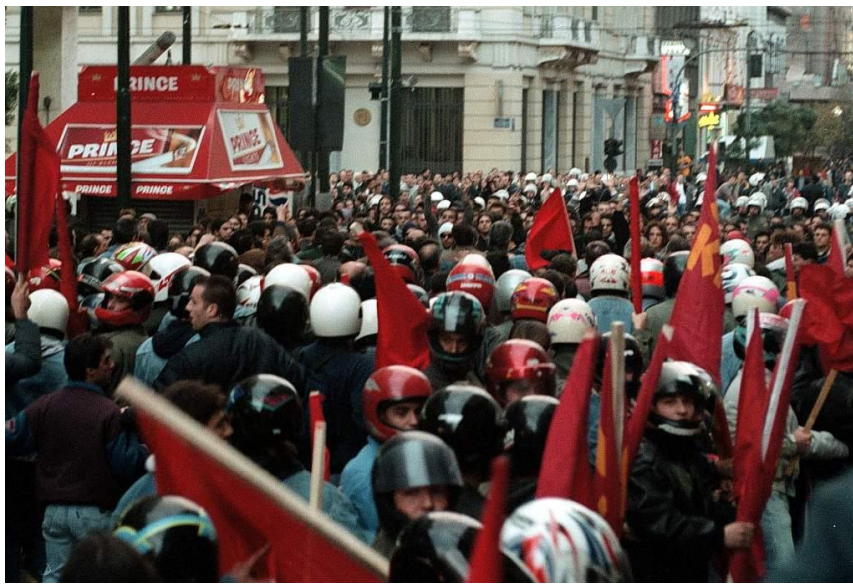
["Τάγμα εφόδου ΚΝΕ" παρελαύνει.]