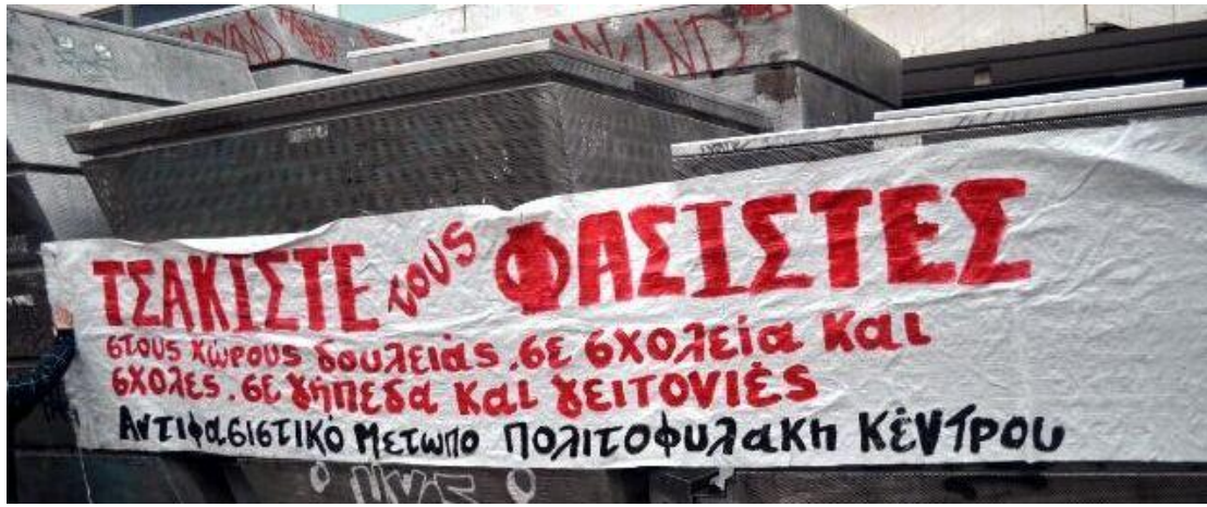
["Προσκλητήριο Παραστρατιωτικής δράσης ANTIFA"]