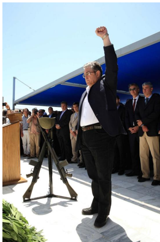
[“Μαρξιστικός” Χαιρετισμός του κ. Δημητρίου ΚΟΥΤΣΟΥΜΠΑ - Γενικού Γραμματέα του ΚΚΕ]