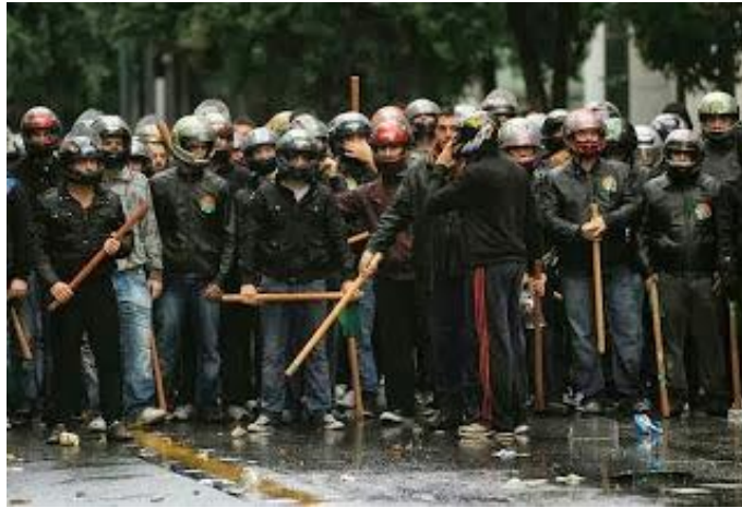
[Τάγμα Εφόδου Σπουδάζουσας Νεολαίας ΠΑΣΠ]