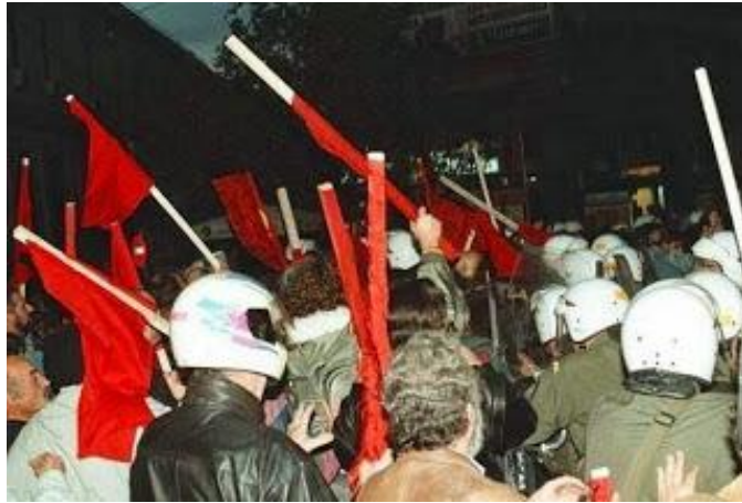
["Τάγμα εφόδου ΚΝΕ" συμπλέκεται με την ΕΛ.ΑΣ.]