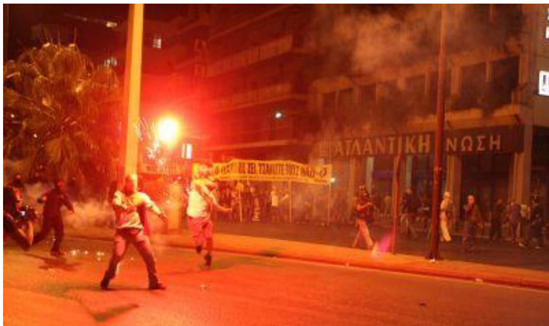
["Συμπλοκές ANTIFA" με άνδρες των ΜΑΤ, με ρίψεις μολότοφ. 25.09.2013]