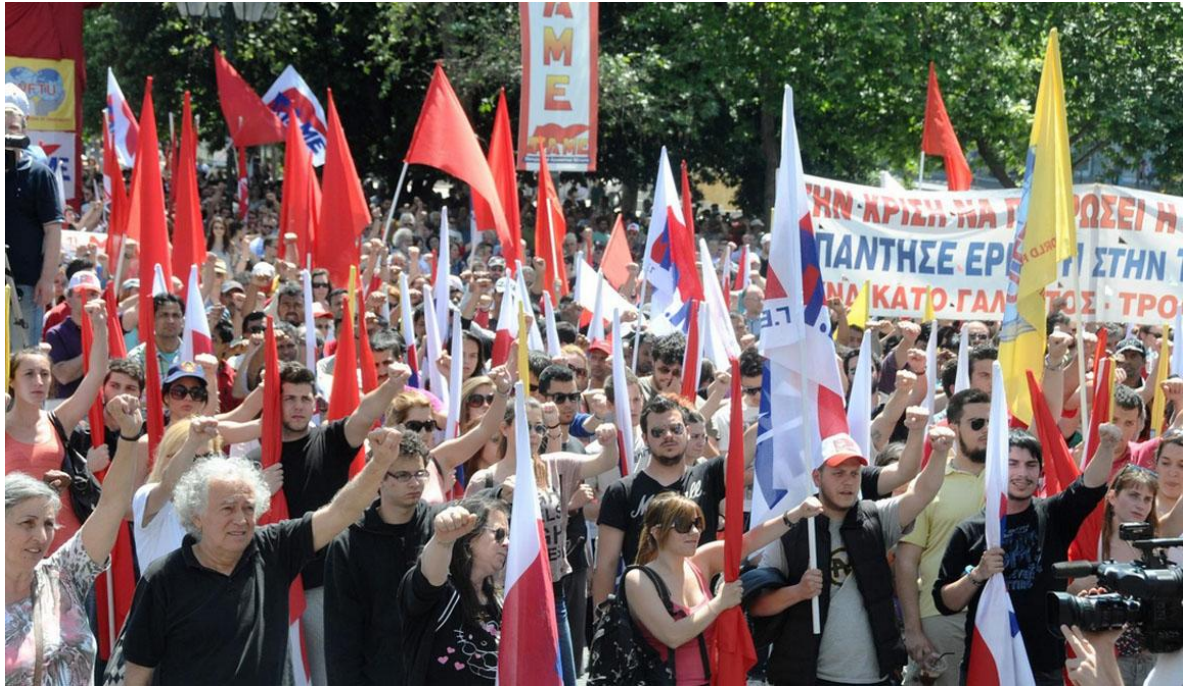
["Μαρξιστικός" Χαιρετισμός υποστηρικτών αριστερών συνδικαλιστικών παρατάξεων]