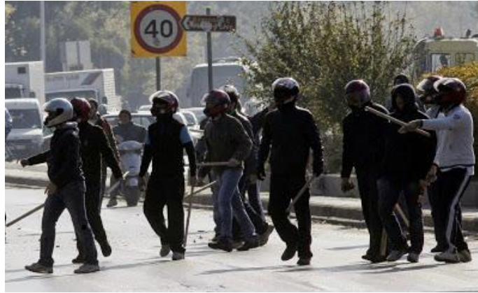
Τάγμα εφόδου ΝΔ – 2007 {ΔΑΠ-ΝΔΦΚ}