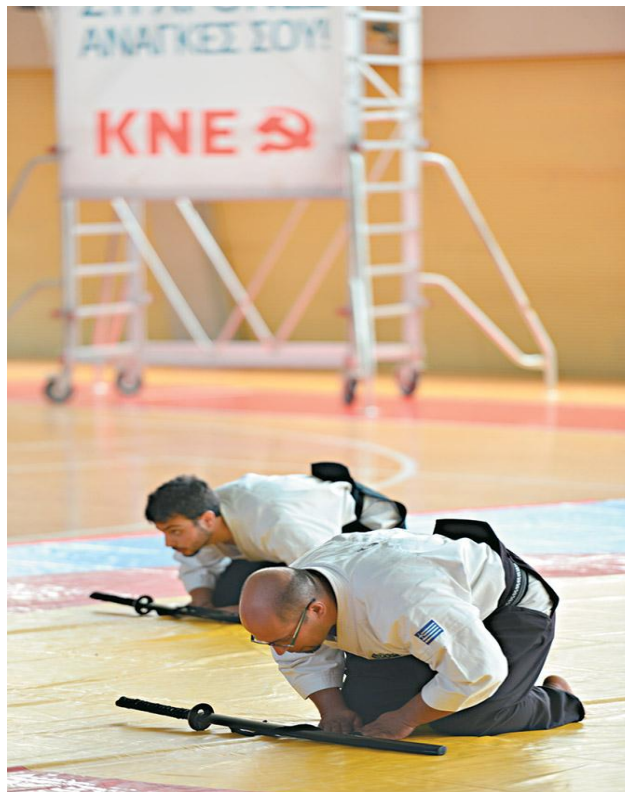
["Εκπαίδευση στελεχών ΚΝΕ στις πολεμικές τέχνες- 2013" ]