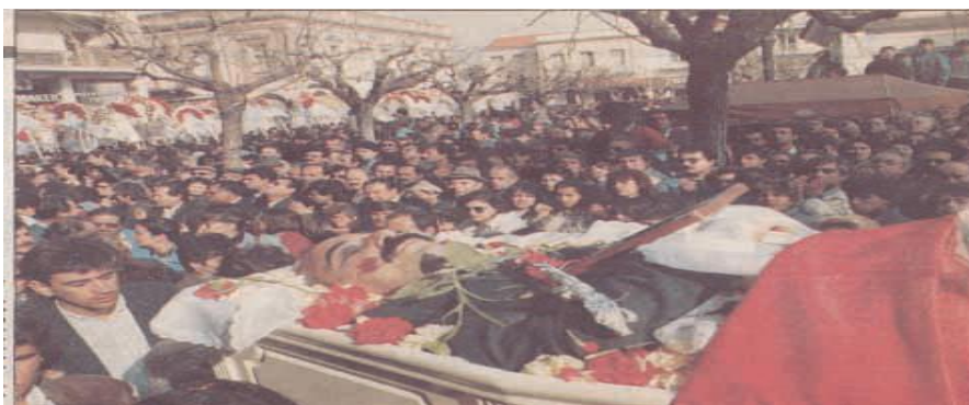
[Μεταφορά της σωρού του Τεμπονέρα]