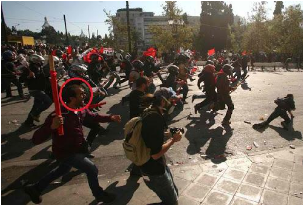
["Τάγμα εφόδου ΣΕ ΔΡΑΣΗ".]