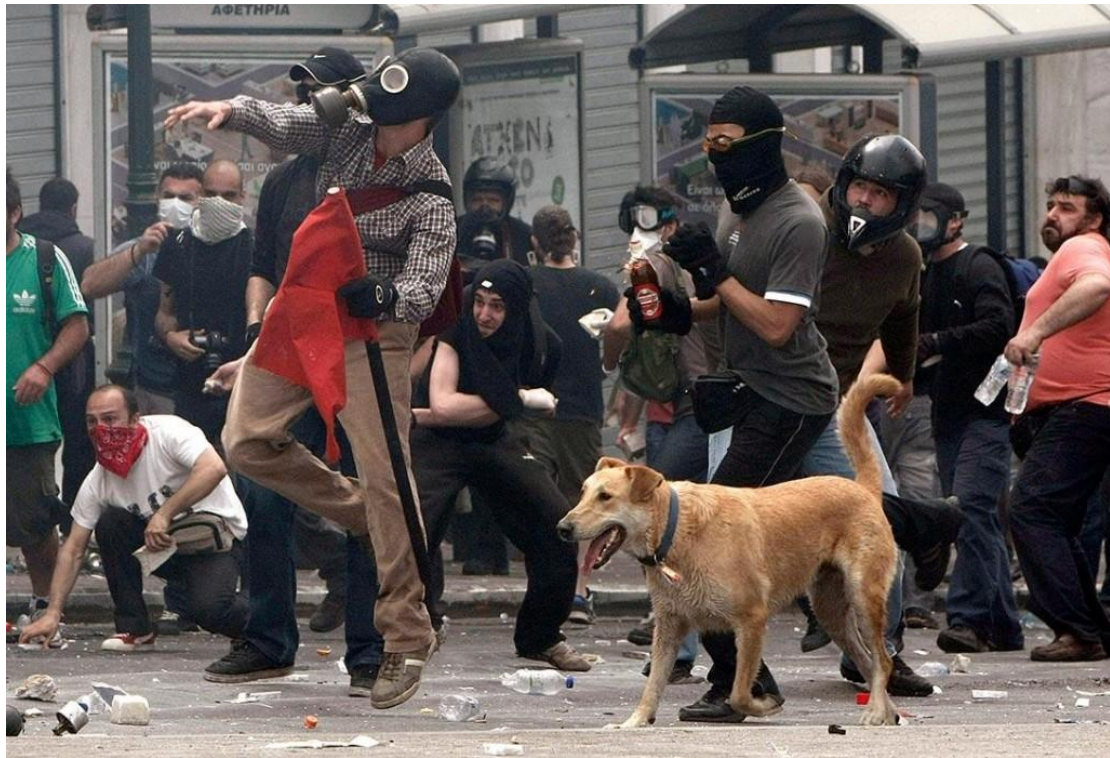
[ "Τάγμα εφόδου "μπαχαλάκηδων" υπό του ΣΥ.ΡΙΖ.Α." ]