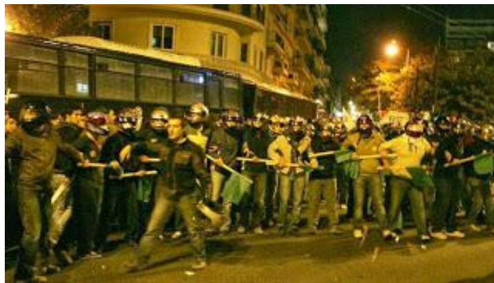
["Τάγμα εφόδου ΠΑΣΟΚ" προετοιμάζεται για συμπλοκή με Νεοδημοκράτες]