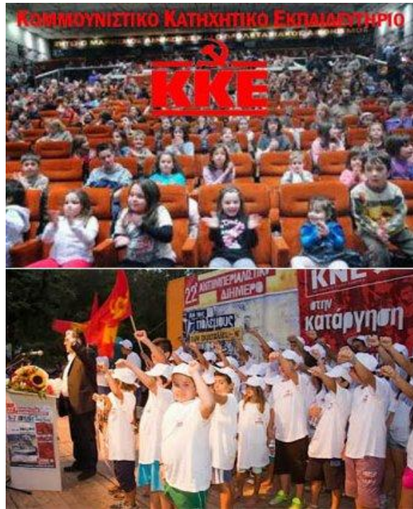
[“Τάγμα Νηπίων” σε εκδήλωση του ΚΚΕ]