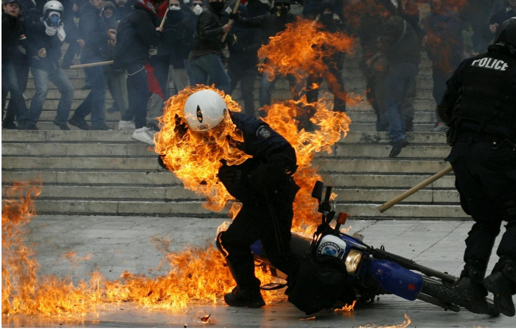
[ "Αναρχικοί και Αντιεξουσιαστές- μέλη ANTIFA" πυρπολούν αστυνομικούς της ΕΛ.ΑΣ. (2012) ]