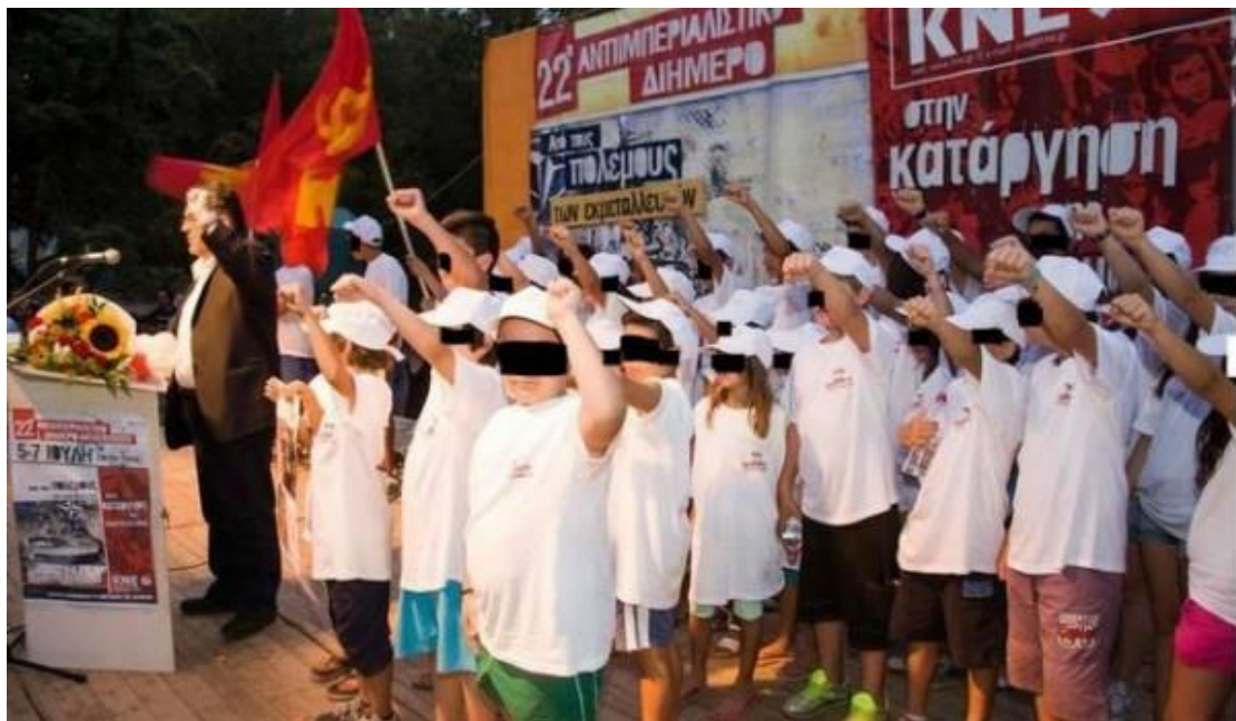
[Παρατεταγμένο "Τάγμα Νηπίων" σε εκδήλωση του ΚΚΕ]