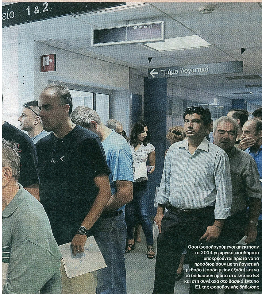
Όσοι φορολογούμενοι απέκτησαν το 2014 γεωργικά εισοδήματα υποχρεούνται πρώτα να τα προσδιορίσουν με τη λογιστική μέθοδο (έσοδα μείον έξοδα) και να τα δηλώσουν πρώτα στο έντυπο Ε3 και στη συνέχεια στο βασικό έντυπο Ε1 της φορολογικής δήλωσης

εκτυπώνουν τα εκκαθαριστικά, χρησιμοποιώντας τους κωδικούς πρόσβασης που διαθέτουν.