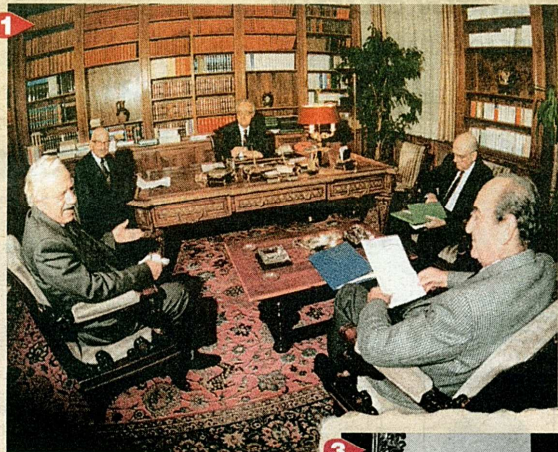
1. Το 1989 αναλαμβάνει πρωθυπουργός στην οικογενειακή κυβέρνηση, στη διάρκεια της οποίας πραγματοποιήθηκε η συνάντηση υπό τον Πρόεδρο της Δημοκρατίας, Χρήστο Σαρτζετάκη και τη συμμετοχή των πολιτικών αρχηγών, Ανδρέα Παπανδρέου, Κωνσταντίνου Μητσότακη και Χαρίλαο Φλωράκη