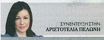
ΣΥΝΕΝΤΕΥΞΗ ΣΤΗΝ ΑΡΙΣΤΟΤΕΛΙΑ ΠΕΛΩΝΗ

Τ ο σχέδιο για τη νέα Υπηρεσία Ευρωπαϊκής Συνοριοφυλακής και Ακτοφυλακής (EBCG) που θα αναλάβει τον έλεγχο των εξωτερικών συνόρων της Ευρωπαϊκής Ένωσης σε μια ύστατη προσπάθεια να διασωθεί η ζώνη Σένγκεν και το οποίο θα παρουσιαστεί την επόμενη εβδομάδα στο Ευρωκοινοβούλιο και στο Ευρωπαϊκό Συμβούλιο παρουσιάζει αποκλειστικά στα «ΝΕΑ» ο Δημήτρης Αβραμόπουλος. Ο επίτροπος Μετανάστευσης, Εσωτερικών Υποθέσεων και Ιθαγένειας παραδέχεται ότι η νέα Υπηρεσία – θα αντικαταστήσει τη Frontex – θα μπορεί να παρεμβαίνει στα σύνορα χωρίς σχετικό αίτημα από κράτος-μέλος.