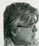
ΤΟΥ ΓΙΩΡΓΟΥ ΣΙΑΚΑΝΤΑΡΗ

Το πρόβλημα δεν είναι απλώς ποιι χαρακτήρισαν τον Α.Π. ως καταστροφή της χώρας, ούτε για ποιους ιδιοτελείς λόγους το είπαν, ούτε ποια είναι η πολιτική τους καταγωγή, ούτε ακόμη το ότι δυσχεραίνουν τη λειτουργία της κυβέρνησης. Σήμερα που ακροδεξιοί και νεοναζιστές επιδιώκουν την απαξίωση της πολιτικής και της Δημοκρατίας, η απαξίωση του Α.Π. είναι ένα μεγάλο βήμα προς αυτή την κατεύθυνση. Η ανάδειξη του πραγματικού του έργου είναι ζήτημα προάσπισης της δημοκρατίας.