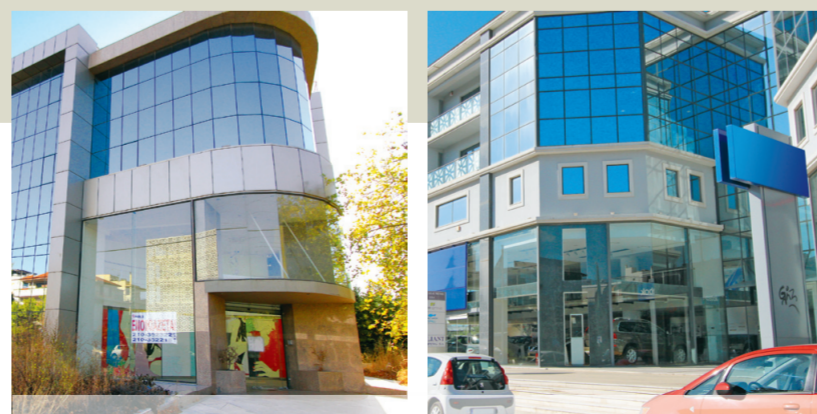
Δύο από τα ακίνητα των 24 εταιρειών του Ομίλου Καρούζου που έχουν δεσμευθεί με εντολή του Σώματος Δίωξης Οικονομικού Εγκλήματος

ΕΝΩ η έρευνα του ΣΔΟΕ συνεχίζεται με ταχείς ρυθμούς για την υπόθεση, οι ελεγκτές του Σώματος έχουν στείλει έγγραφο, με την ένδειξη «εξαιρετικά επίερον» και τίτλο «Διασφάλιση συμφερόντων του Δημοσίου», προς τα κατά τόπους υποθηκοφυλακεία, με το οποίο έχουν δεσμευτεί τα ακίνητα 24 εταιρειών του Ομίλου Καρούζου. Με το έγγραφό του, το ΣΔΟΕ ζητεί από τα υποθηκοφυλακεία να μη μεταβιβαστεί κανένα από αυτά τα ακίνητα «επειδή η υπηρεσία μας ερευνά υπόθεση φοροδιαφυγής μεγάλης έκτασης», όπως αναφέρεται χαρακτηριστικά.