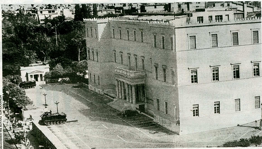
21 Απριλίου 1967. Η Βουλή των Ελλήνων περικυκλωμένη από τεθωρακισμένα του στρατού