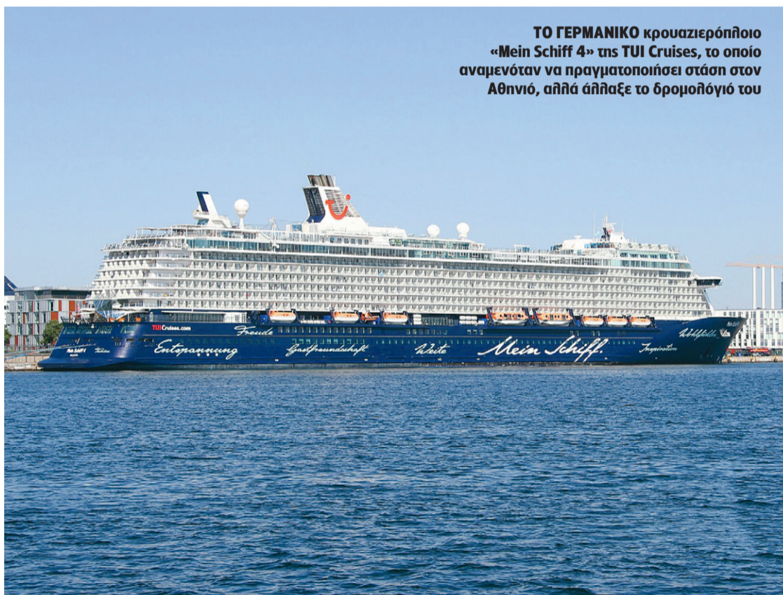
ΤΟ ΓΕΡΜΑΝΙΚΟ κρουαζιερόπλοιο «Mein Schiff 4» της TUI Cruises, το οποίο αναμενόταν να πραγματοποιήσει στάση στον Αθηνιώ, αλλά άλλαξε το δρομολόγιό του

γώνης και συμπληρώνει: Μέχρι πριν από μερικά χρόνια, η Σαντορίνη ήταν ο καλύτερος τουριστικός προορισμός και τώρα έχουμε φτάσει σε αυτό το σημείο. Ας μην κοροϊδευόμαστε, την ευθύνη για αυτή την κατάσταση την έχει ο δήμος. Κάθε χρόνο είμαστε και χειρότερα. Ο δήμαρχος δεν μπορούσε να προνοήσει; Τόσα χρόνια δεν έβλεπε το πρόβλημα, ότι η Σαντορίνη θα μείνει χωρίς λιμάνι; Δεν αφήνεις τον τόπο σου έτσι».