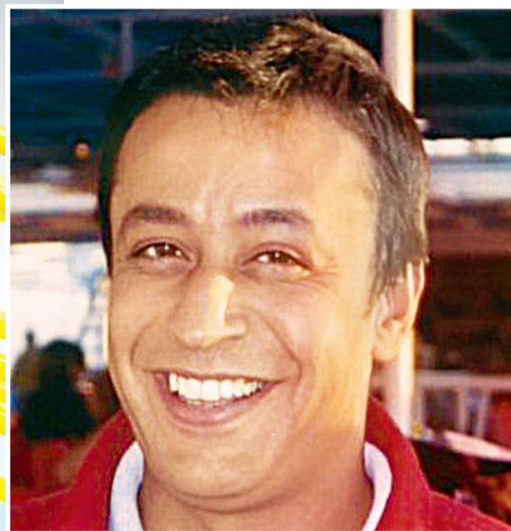
Ο ΣΧΕΔΙΑΣΤΗΣ Δικτύου και διευθυντής Τεχνολογίας της Vodafone είχε βρεθεί απαγχονισμένος στο μπάνιο του σπιτιού του στον Κολωνό

Ωστόσο, όπως αναφέρεται στην απόφαση του δικαστηρίου, ο εισαγγελέας «αποφάσισε να κλείσει την έρευνα, υποστηρίζοντας τα συμπεράσματα της διάταξης 80/06 (με την οποία είχε αρχειοθετηθεί η αρχική έρευνα) και παραθέτοντας απλώς τα σχετικά βήματα που έγιναν κατά τη διάρκεια της συμπληρωματικής έρευνας, χωρίς να εξετάσει κανένα από τα παραπά-