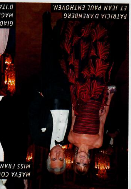
MAËVA COUCKE, MISS FRANCE 2018