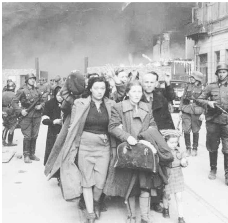
Χαρακτηριστικές σκηνές από τη βίαιη συμπεριφορά των Γερμανών στρατιωτών κατά τη μεταφορά των Εβραίων της Θεσσαλονίκης στα στρατόπεδα συγκέντρωσης.