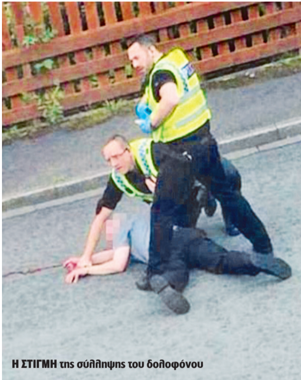
Η ΣΤΙΓΜΗ της σύλληψης του δολοφόνου

να 24ωρα έως την Πέμπτη την κρίσιμη ψηφοφορία, δυναμιτίζοντας ακόμη περισσότερο το ήδη πολωμένο κλίμα που επικρατούσε τις τελευταίες ημέρες. Με τη γνωστοποίηση του τραγικού γεγονότος, ακυρώθηκαν όλες οι προεκλογικές συγκεντρώσεις και των δύο εκστρατειών, υπέρ και κατά του Brexit, ενώ από την πρώτη στιγμή ο ίδιος ο Βρετανός πρωθυπουργός Ντ. Κάμερον ακύρωσε προγραμματισμένη ομιλία του, το ίδιο βράδυ της δολοφονίας, στο Γιβραλτάρ.